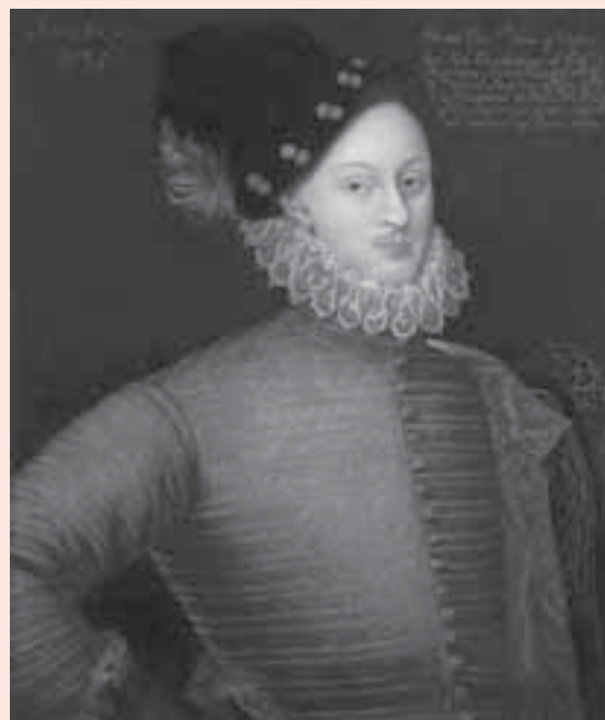
Edward de Vere

De meeste complottheorieën vullen dergelijke lacunes in onze kennis met een relatief eenvoudig, elegant scenario. In dit voorbeeld is er zelfs een concrete, historische persoon – Edward de Vere, wiens levensloop wat beter gedocumenteerd is dan die van Shakespeare – die in één klap alle gaten in onze kennis kan opvullen en alle problemen kan oplossen rond het auteurschap van de werken die traditioneel toegeschreven worden aan Shakespeare.