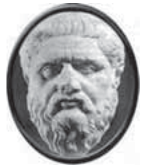
Gorgias van Leontini

Onze vriend Gorgias van Leontini volstaat evenmin met epistemologisch scepticisme. Hij gaat nog een stapje verder: als wij dat wel zouden kunnen kennen, zouden wij het niet kunnen mededelen. Dat heet ‘concep-