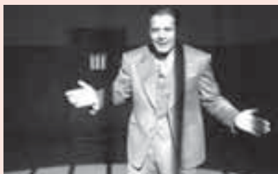
Advocaat Freddy Riedenschneider (Tony Shalhoub) legt het ‘onzekerheidsbeginsel’ uit in The Man Who Wasn't There , een film van Joel en Ethan Coen uit 2001 (still uit de film)

Ze hebben die kerel in Duitsland... Frits, of zoiets, of is het... misschien is het Werner? Hoe dan ook... hij heeft die theorie... je wil iets testen, je weet wel, wetenschappelijk... hoe de planeten rond de zon draaien, waaruit sproeten bestaan, waarom er water uit de kraan komt? Wel, je moet ernaar kijken, maar soms... verandert jouw blik, jouw kijken het... je kan niet weten wat er werkelijk gebeurde, of wat er gebeurd zou zijn als je er je neus niet in had gestoken. Dus er is geen ‘wat er gebeurde’. Doordat je naar iets kijkt, verandert het. Ze noemen dat het onzekerheidsbeginsel. Het klinkt zeker gek, maar zelfs Einstein zegt dat de kerel een punt heeft. Wetenschap... Perceptie... Werkelijkheid... Twijfel... Gereede twijfel... Wat ik zeg, is dat soms... Hoe meer je kijkt, hoe minder je werkelijk weet. Het is een feit. Een bewezen feit. In zekere zin is het het enige feit dat er is. Deze Heiny schreef het zelfs uit in cijfers.