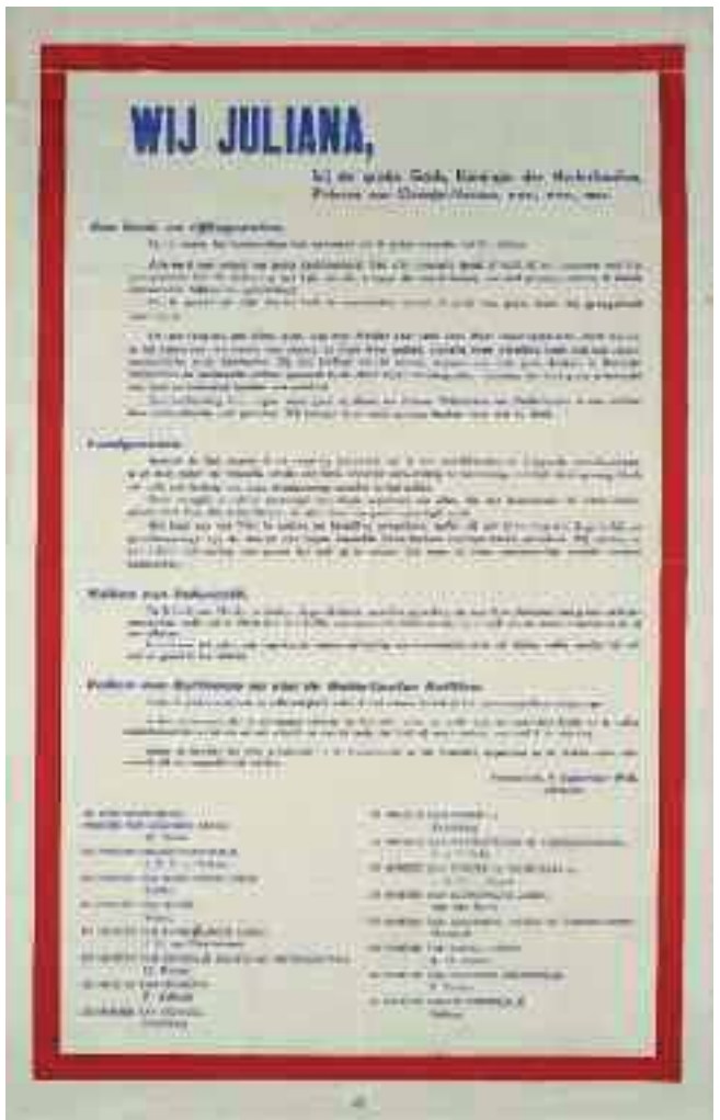
BIJ DE GRATIE GODS Ook de Nederlandse vorsten, tot Willem Alexander aan toe, omschrijven hun legitimiteit in officiële stukken als verleend 'bij de gratie Gods'. Vanuit de gedachte dat staat en kerk strikt gescheiden moeten worden is daartegen inmiddels enig verzet gerezen, dat vooralsnog echter niet veel enthousiasme losmaakt.

Zo heeft in het politieke bestel een coherent systeem plaats moeten maken voor het tamelijk onlogische, provisorische en van toeval en tast afhankelijke systeem dat wij 'parlementaire democratie' noemen. Daarin is elk absoluut richtpunt verloren gegaan. Het heeft centrum noch zekerheid, zoekt zijn oriëntatie gaandeweg en is zelden bijzonder constant. Daarom balanceert het altijd op de rand van zijn eigen afschaffing. De gedachte aan een bestel dat vast verankerd is aan één zekere en richting-