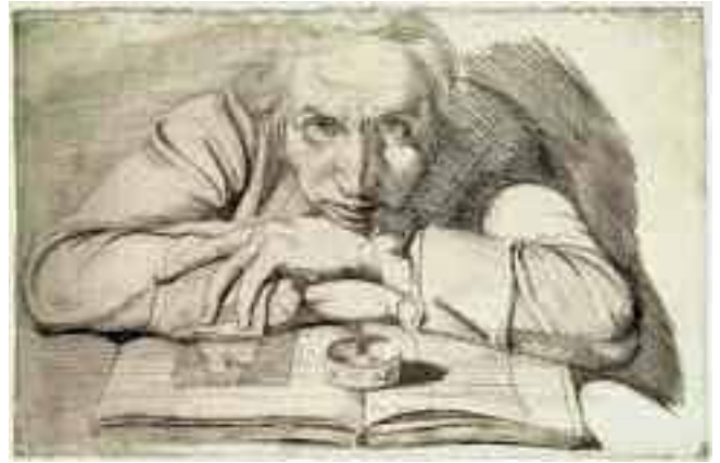
Portret van een man, waarschijnlijk John Cartwright, getekend door Johann Heinrich Füssli, daterend uit ca. 1779, de tijd van de vroege Romantiek.

We beschouwen onszelf als onderling gelijke of minstens gelijkwaardige wezens, maar juist in onze uniciteit vinden we onze