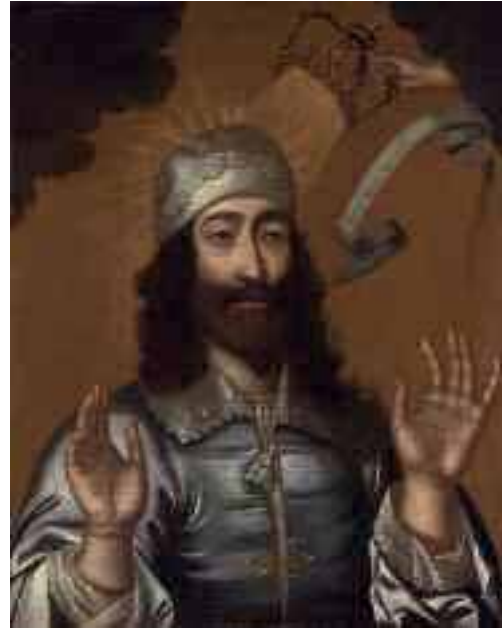
GODDELIJKE SOEVEREINITEIT De Engelse koning Karel I wordt via de kroon beschenen door het goddelijk licht.

over het middeleeuwse denken in het uiterste geval de oplossing van de tirannenmoord toelaatbaar achtte, hebben we het hier niet. Het gaat ons om de opbouw en samenhang van het model volgens hetwelk de werkelijkheid ingericht heette te zijn. Dat model was volstrekt coherent. Dankzij zijn directe, sacramentele band met God vielen legitimiteit, goedheid en wijsheid in de vorst samen. Wat hij deed was niet alleen rechtens gewaarborgd, maar kon ook geacht worden voort te komen uit de onfeilbare alwetendheid die God toekwam.