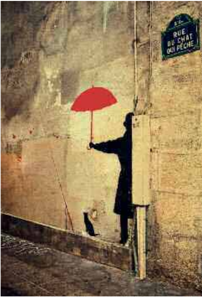
Muurschildering in de Rue du Chat qui Pêche, de smalste steeg van Parijs.

de man, vastgelegd door een straatartiest? Of een variatie op de surrealistische 'bolhoedman' van Magritte, als herinnering aan de oude wijsheid dat de werkelijkheid maar schijn is? En wat doet die kat daar? Zit hij bij zijn hengel te wachten, precies onder de paraplu, totdat hij eindelijk beet heeft? Waar vist hij dan op? Die kat is een knipoog naar het straatnaambordje, maar de betekenis van het totale beeld blijft in het ongewisse.