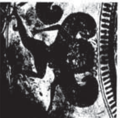
Afb. 39 Gorgo.