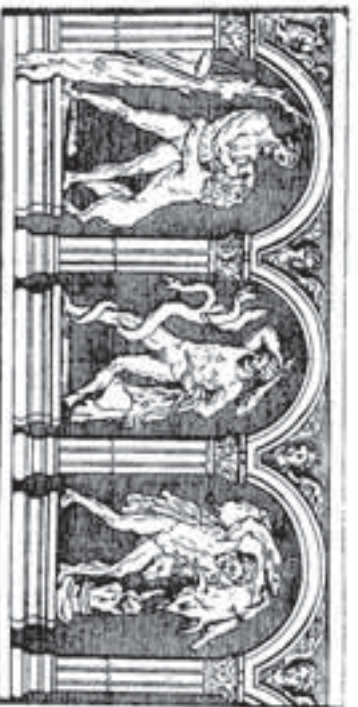
Afb. 38 De eerste drie daden van Heracles.