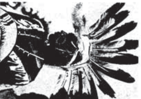
Afb. 40 Indische danser met feesttooi.

et is een aantal opmerkelijke zaken te vinden. De hoofdtooi van adelaarsveren heeft een magische betekenis. De Indianen neemt iets van het zonnekarakter van deze vogel over wanneer hij zich met diens veren tooit, precies zoals men zich de moed of de kracht van een vijand toetigt, wanneer men diens hart verblindt of diens scalp verovert. De veren kroon heeft tegelijkertijd dezelfde betekenis als de stralenkroon van de zon (afb. 40). Hoe belangrijk de identificatie met de zon is, hebben wij in het eerste deel (VW 7) gezien. Verder te bewijzen hiervoor vinden wij niet alleen in talrijke oude gebruiken, maar ook in even oude religieuze spraakfiguren, bijvoorbeeld in de Wysheid van Salomo 5:16: 'Daarom zullen zij ontvangen... een schone kroon uit de hand des Heren.' 16 In de bijbel zijn nog talrijke andere passages te vinden. In een hymne van Johann Ludwig Konrad Allendorf wordt over de ziel gezegd: