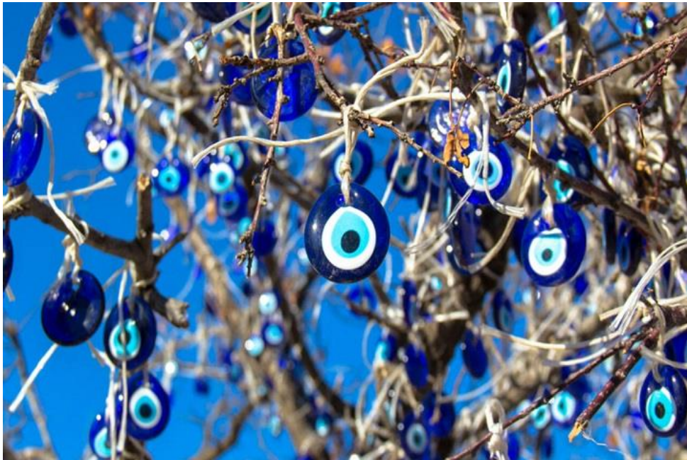
Een nazar, een bekende amulet om je geluk te brengen

afbeelding, een sieraad, een edelsteen of bijvoorbeeld een vogelveer. Je kunt ook zelf iets kiezen dat je een gelukkig gevoel geeft en waar je kracht uit haalt, bijvoorbeeld uit een beeldje, een knuffel, een parfumsflesje of een mooie pen. Je kunt ook zelf een amulet of talisman maken. Op internet vind je allerlei voorbeelden. Vaak zijn die geïnspireerd door de natuur (alweer!). Dit is een leuke handleiding met uitleg: www.tropenmuseum.nl/nl/zien-en-doen/thuisactiviteiten/maak-je-eigen-amulet