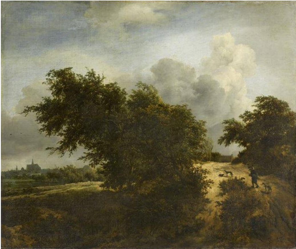
Duinlandschap bij Haarlem door Jacob van Ruysdael, ca. 1647

Nu je je toch zo verdiept hebt in landschappen, kun je daar ook een prachtig schilderij bij maken. Dat dacht men ook in de zeventiende eeuw, toen het (Nederlandse) landschapsschilderen erg populair was. Steeds meer kunstenaars lieten zich inspireren door onze natuur en legden bergen, valleien, weiden, bomen, rivieren, zeeën en bossen vast op hun doeken. Vaak schilderden zij er enkele mensen of dieren bij. Nog altijd zijn deze sprookjesachtige landschappen geliefd. Hier lees je er meer over: kunst-en-cultuur.infonu.nl/kunst/160697-schilderkunst-17e-eeuw-landschapsschilderkunst.html .